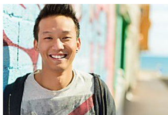
24 Business News 25 year old Malaysian is one of http://www.24businessreport.com/