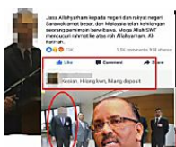
PTD hina kematian Adenan dipanggil pulang

( http://www.bharian.com.my/node/196597 )