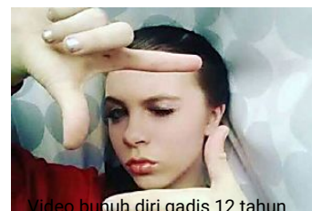
Video bunuh diri gadis 12 tahun http://www.bharian.com.my/node/28547