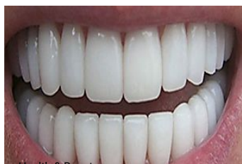
Health & Beauty Tip That Finally Turned Yellow http://www.bharian.com.my/node/28547