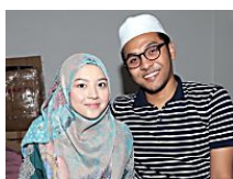
Isteri meninggal pada sambutan ulang tahun pertama perkahwinan

( http://www.bharian.com.my/node/196597 )